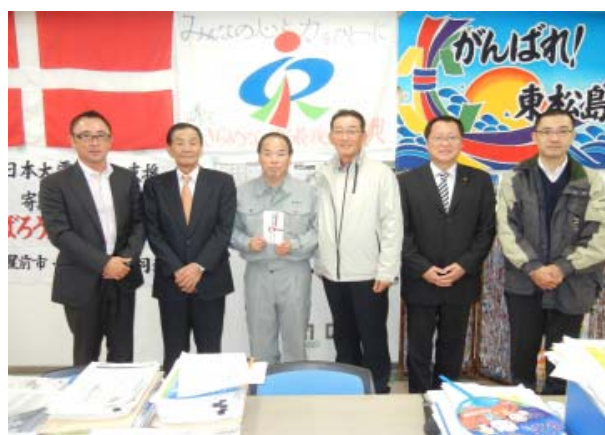
阿部秀保東松島市長（左 3 人目）に支援物資目録を伝達