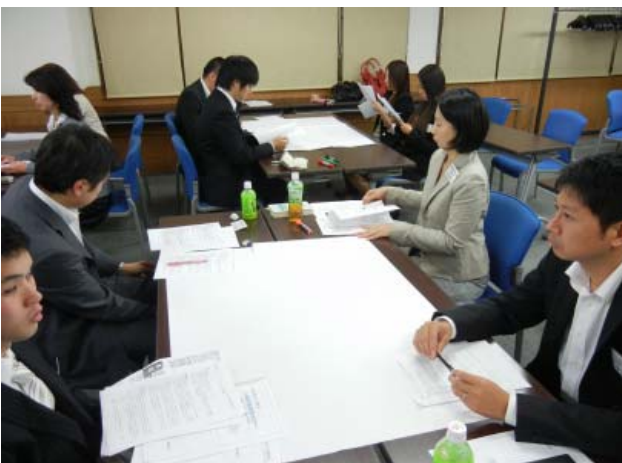
委員から出された課題に対して塾生が班に分かれ分析・ディスカッションと発表を行った。