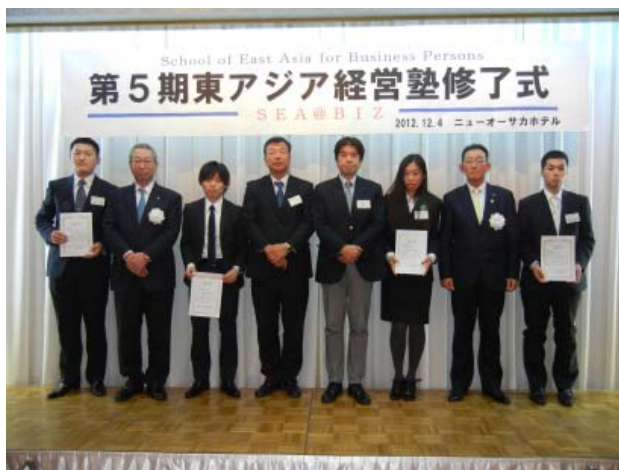
【修了式】塾生に修了証を授与