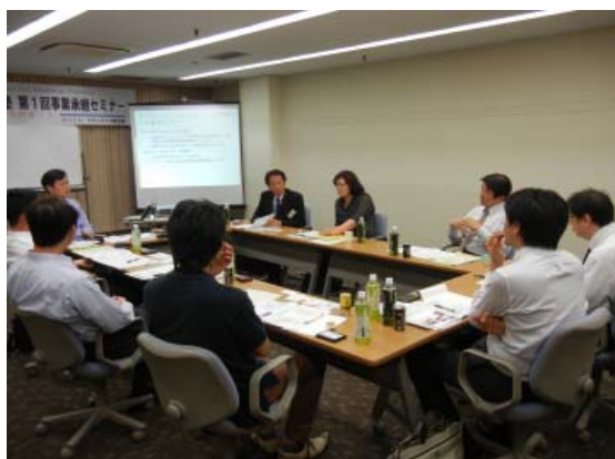
講演内容を基に創業と後継に関してディスカッション