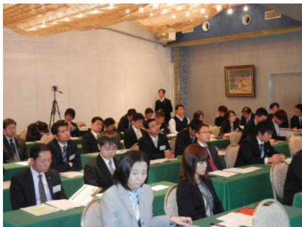
熱心に聴講する塾生