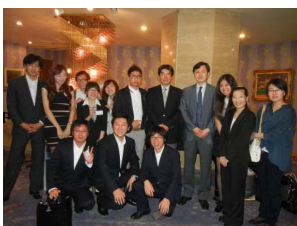
【開講式】委員・塾生全体写真

第2回 * 2012.8.28(火)19:00 ~ 21:00 於：ニューオオサカホテル