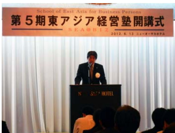
【開講式】李基悟委員長の主催挨拶