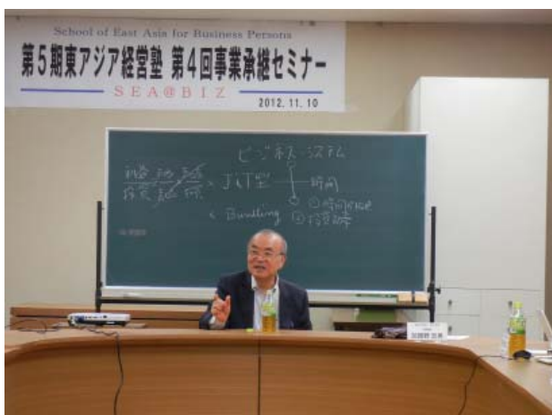
経営学の大家・加護野忠男 神戸大学名誉教授の特別講演