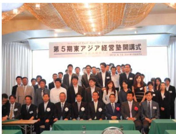
【開講式】委員・塾生全体写真