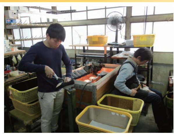
▲婦人靴製造現場 (ラクダ護謄工業株)