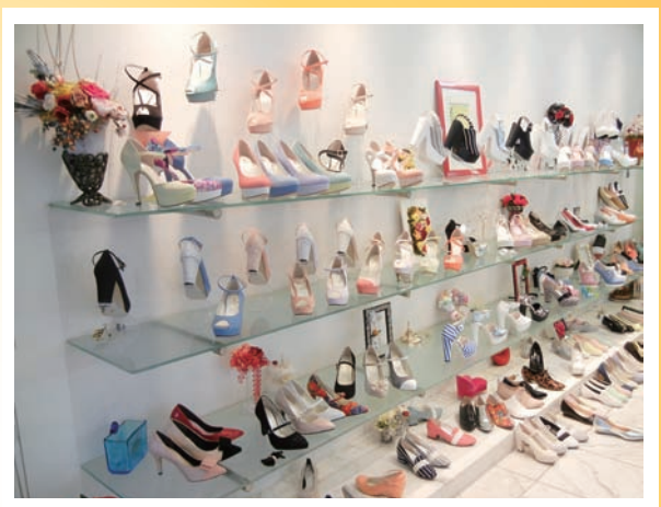
▲シューズメーカー (株青山) のショールーム